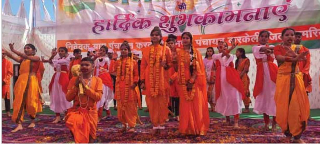
सांस्कृतिक कार्यक्रम की मनमोहक प्रस्तुति दी गई। छात्र-छात्राओं की मनमोहक प्रस्तुति को देखकर उपस्थित जनसमूह और अतिथि गण देश भक्ति के

तत्पश्चात मंचीय कार्यक्रम की शुरुआत की गई, जहाँ पर ग्राम पंचायत करकेली के आस पास के विद्यालय से आए छात्र-छात्राओं के द्वारा